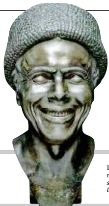
L'artista come si immagina mentre sta per ridere è una scultura di stagno realizzata tra il 1777 e il 1781