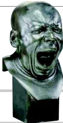
L'uomo che sbadiglia, realizzato fra il 1771 e il 1781 è l'ennesima dimostrazione del virtuosismo di Messerschmidt