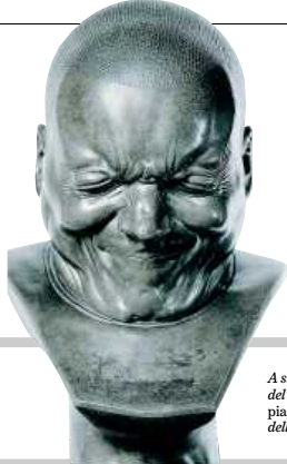
A sinistra Uno scellerato del 1771-1783, sopra L'uomo che piange come un bambino della stessa epoca