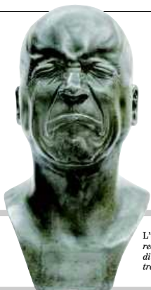
L'uomo di cattivo umore realizzato in lega di stagno e piombo tra il 1771 e il 1783