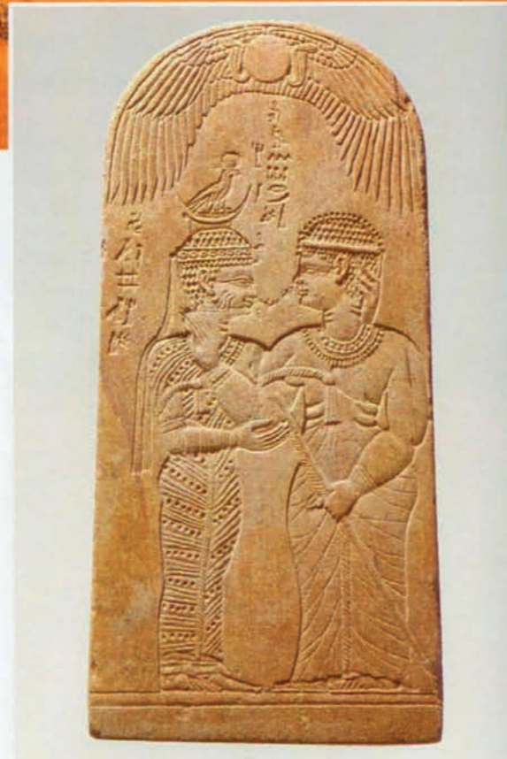
Stèle, avec la représentation de la candace Amanishakheto (à droite) recevant le souffle de la déesse Asemsemi, Naga, 1 er moitié du I er siècle, musée national, Khartoum.

« L'île de Méroé » – pour reprendre l'expression chère à Diodore de Sicile ou à Strabon – était circonscrite par