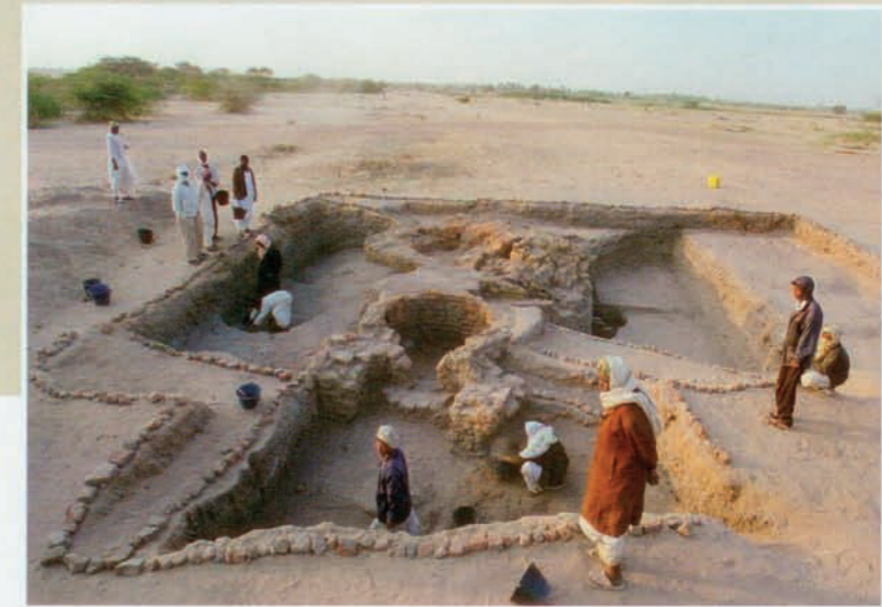
Trois fours de potier et de briquetier, quartier industriel de Mouweis.