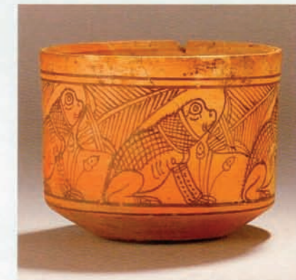
Gobelet caréné à décor peint de grenouilles assises, terre cuite, British Museum, Londres.

D'admirables gobelets en verre aux parois délicatement peintes et dorées trahissent, quant à eux, de fortes influences méditerranéennes. Dans la mesure où l'on n'a pas retrouvé de traces d'ateliers de verrerie au sud de l'Égypte, les archéologues admettent qu'il s'agit de pièces d'importation.