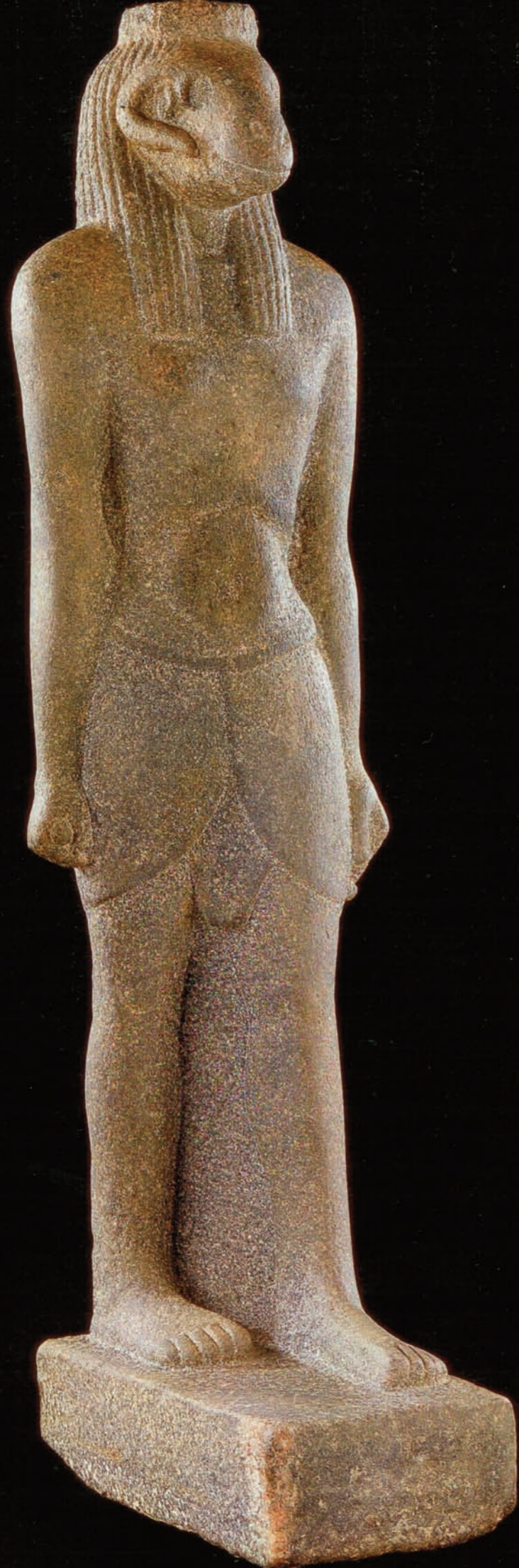
Statue du dieu Amon à tête de bélier, Jebel Barkal, III e -IV e siècle av. J.-C., Musée national, Khartoum.