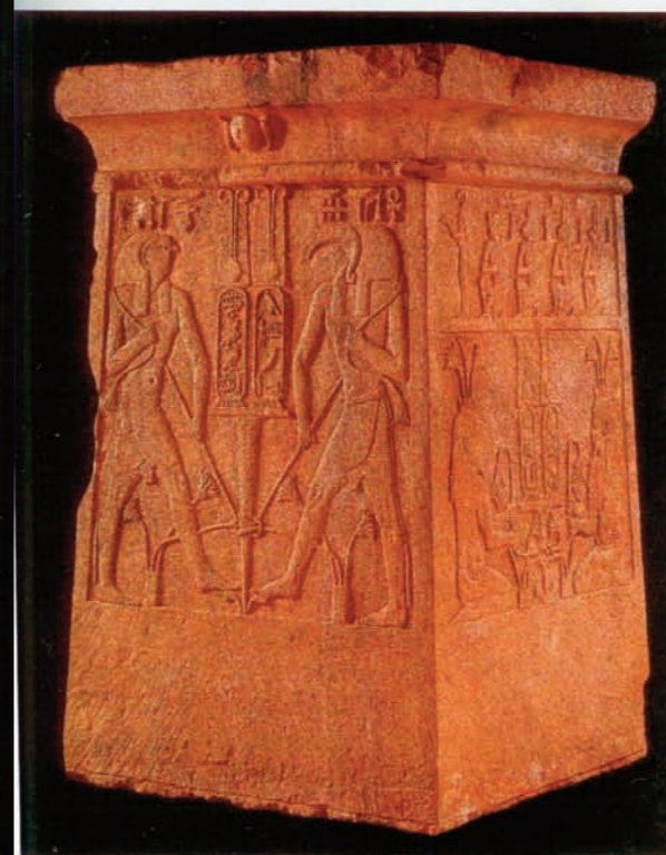
Relief au nom de Natakamani et Amanitore, grès, Musée national, Khartoum.

Pour nombre de visiteurs, le nom de Méroé ne dit rien. Tout au plus évoque-t-il pour les amoureux de littérature un merveilleux roman né sous la plume d'Olivier Rolin. C'est donc un véritable choc que devrait provoquer l'exposition du Louvre, tant la beauté des pièces présentées le dispute à leur singularité : si proches et si différentes de l'art égyptien, si « pharaoniques » et si « africaines » tout à la fois.