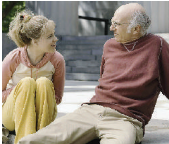
Una scena di «Basta che funzioni» di Woody Allen, al Cristallo domani sera

attore, fino all'ultimo Woody Allen, «Basta che funzioni», film a cui spetta il compito di aprire la rassegna. L'appuntamento è per dodici venerdì sera, da domani fino al 15 gennaio 2010: alle 21 una breve scheda tecnica a cura del cinecircolo introdurrà ogni film, alle 21,30 la proiezione, 6 euro i biglietti singoli, 35 l'abbonamento all'intera rassegna (disponibili all'edicola Marchiaro, alla cassa del cinema Cristallo e nei bar di San Damiano, ad Asti alla libreria Il Pellicano di corso Alfieri 338). Continua, come l'anno scorso, il connubio con l'enogastronomia: in programma (verranno organizzate di volta in volta) quattro dopo-cinema dedicati a vini e prodotti tipici di stagione.