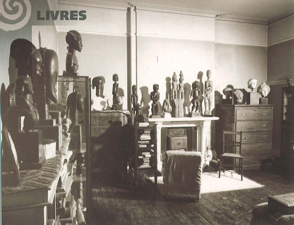
FIG. 1 (A GAUCHE) : Vue de la chambre de Jacob Epstein peu avant sa mort en 1959.